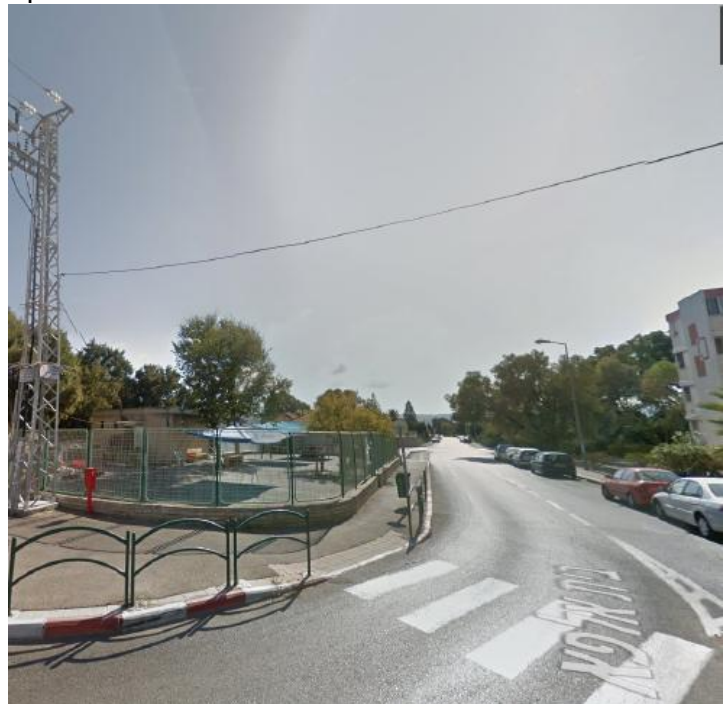
עמוד 6 מתוך 9

צילום של עמוד חשמל משדרות מחל פינת רחוב בית אלפא - קו מתח נמוך עובר לאורך שדרות מחל ומשם הזנה לגן.